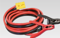
2 x 8 m - 16 mm 2 056572