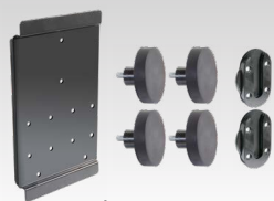
Stödjer MagnetFix 029637